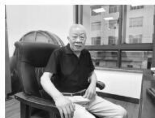
屈统产老人讲述抗日保卫战的历史