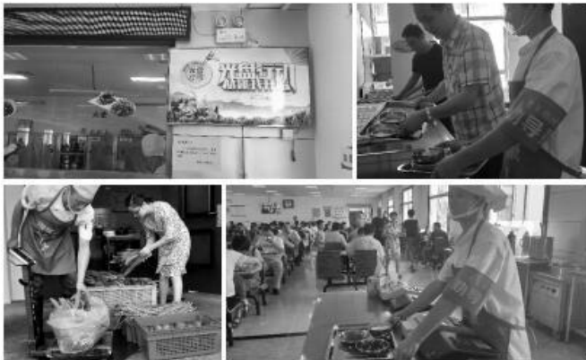
2020年第3期 台州市机关事务管理研究会会刊