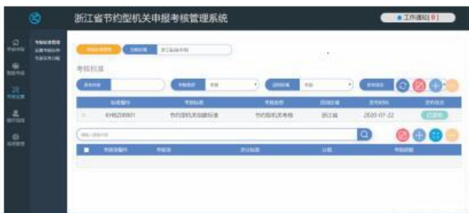
(公司为浙江省公共机构开发的节约型机关创建申报、评审平台,该平台一期将在全省8000余家党政机关服务)

浙江力德节能科技有限公司成立于2010年,是浙江省知名智慧能效解决方案提供商,高新技术企业。公司融合物联网、云计算、BIM、区块链技术,为用户提供能耗统计、能源审计、节能改造、信息化能源管控平台、合同能源管理、一站式能源托管等综合能效服务,实现设备设施安全、智慧、节能运行。