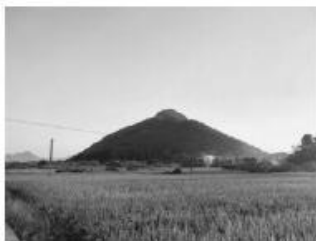
骊山位于临海市东碇镇屈家村的西南面