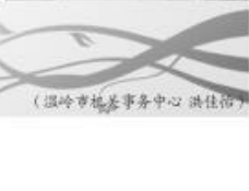
(温岭市机关事务中心 洪佳佳)