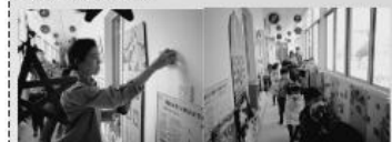
图八：消防演练教师报警 图九：消防演练人员疏散

湿毛巾，捂住口鼻，低头弯腰一组一组地撤离活动室。而在这同时，保育员阿姨则快速取来灭火器进行初期火灾的扑灭，随即加入到班级人员的疏散工作中。该班级的两位老师和一位保育员分工明确、各司其职，根据预案的分工要求，快速、成功地将幼儿带到制定的安全区域。