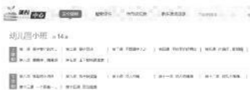
图一:安全教育平台小班安全课程截图

我园自2014年开始运用“台州市安全教育平台”有计划地开展安全教育课程。该平台根据各年龄段幼儿的身心特点,从交通安全、消防安全、食品安全、生活安全、防触电、防溺水等方面,系统全面地开展安全教育。除此之外,还有专题活动,如:开学第一课、119消防专题、122交通安全日专题、防溺水专题、安全教育日专题等等。平台的运用,为我们教师开展安全教育提供了全面的内容,使用起来非常方便。